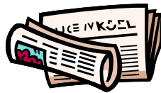
Det är en tidning.