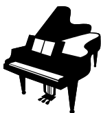
Det är ett piano.