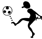
Han spelar fotboll.