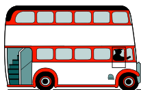
Det är en buss.